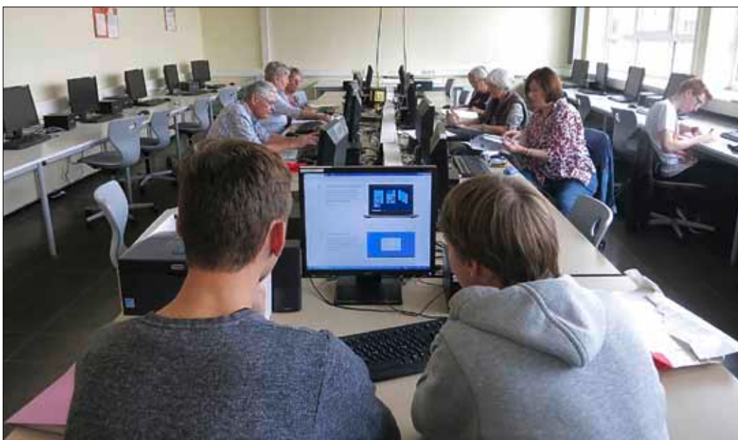
Thema der heutigen Stunde – der Aufbau von Microsoft Office.