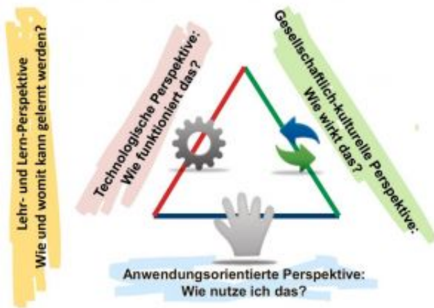
_ Abb. Ira Diethelm, Uni Oldenburg / gelber Text: J.-P.